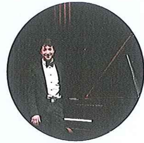
Concert a l'Auditori de la Fundación Juan March