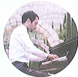
Concert a la Cartoixa d'Escaladei