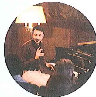
Concert al Jardí dels Tarongers